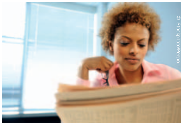
Europa potrzebuje nowych przedsiębiorstw

W nadchodzących latach Komisja zamierza również wspierać rozwój przedsiębiorstw społecznych – które służą interesowi społeczności i zamiast dążyć do osiągnięcia zysku, realizują cele socjalne, społeczne i środowiskowe – oraz ogólniej gospodarki społecznej. UE może również odegrać rolę w promowaniu finansowania społecznościowego (ang. crowdfunding), które za pośrednictwem internetu pomaga pozyskać środki dla małych firm i przedsiębiorstw rozpoczynających działalność. W czerwcu 2013 r. Komisja zorganizowała pierwsze warsztaty w celu przeanalizowania różnych kwestii związanych z finansowaniem społecznościowym i rozważa podjęcie ewentualnych inicjatyw politycznych.