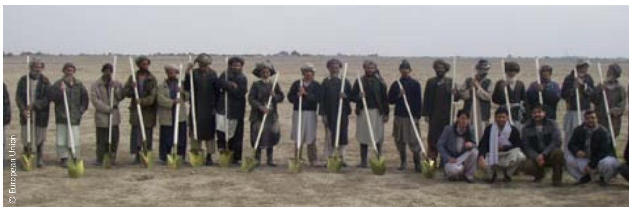
Afgańscy otrzymują narzędzia w ramach działań finansowanych przez ECHO podjętych w odpowiedzi na suszę, która wywołała głód i przemieszczenia ludności

Traktat lizboński, który wszedł w życie 1 grudnia 2009 r., wprowadził podstawy prawne pomocy humanitarnej UE, jak również strategii