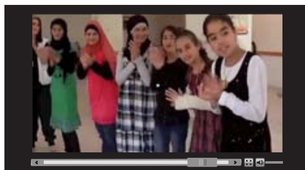
Dzięki edukacji dzieci będące ofiarami konfliktów mają szansę na normalne dzieciństwo

UE na rzecz dzieci-ofiar konfliktu ( http://ec.europa.eu/echo/EU4children/index_en.htm )