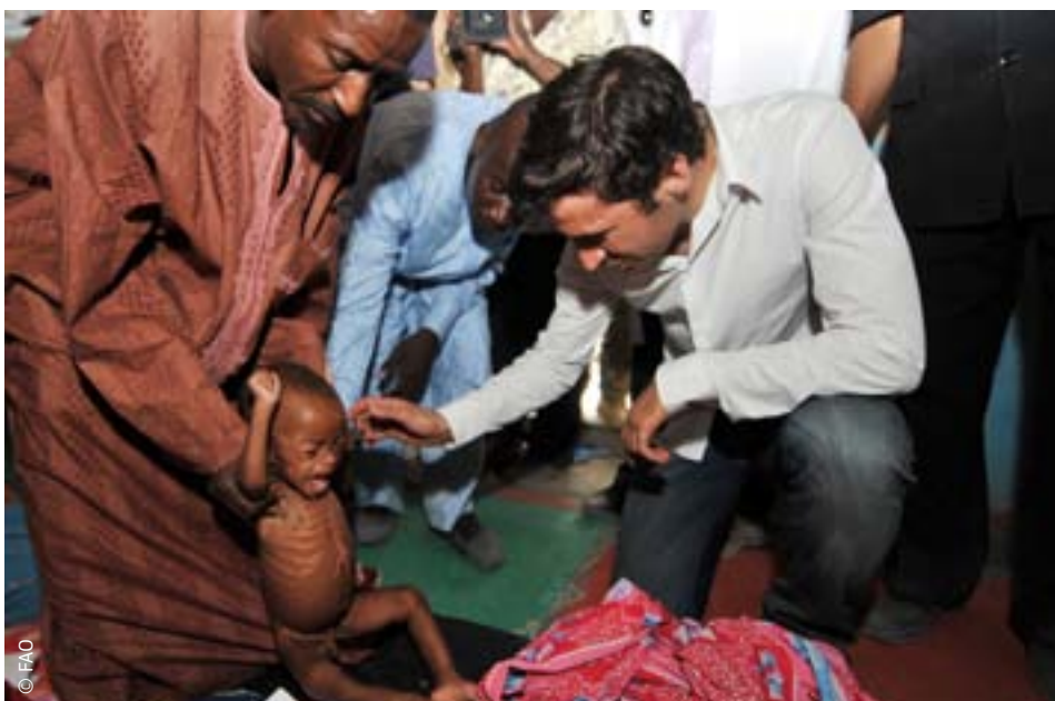
Raúl González odwiedza Czad w ramach kampanii „Piłkarze walczą z głodem”

Na całym świecie narasta zjawisko głodu i niedożywienia. W 2010 r. uznano, że ponad miliard ludzi na całym świecie nie ma zabezpieczonego dostępu do żywności. W regionie Sahelu i Rogu Afryki susza naraża na widmo głodu miliony osób. Brak bezpieczeństwa żywnościowego dotyczy także grupy ludności w trudnej sytuacji w innych krajach, takich jak Pakistan czy Jemen. Wsparcie żywnościowe ma największy udział w budżecie UE przeznaczonym na pomoc humanitarną. W 2011 r. UE udostępniła 509 mln euro na potrzeby humanitarnego wsparcia żywnościowego i żywienia.