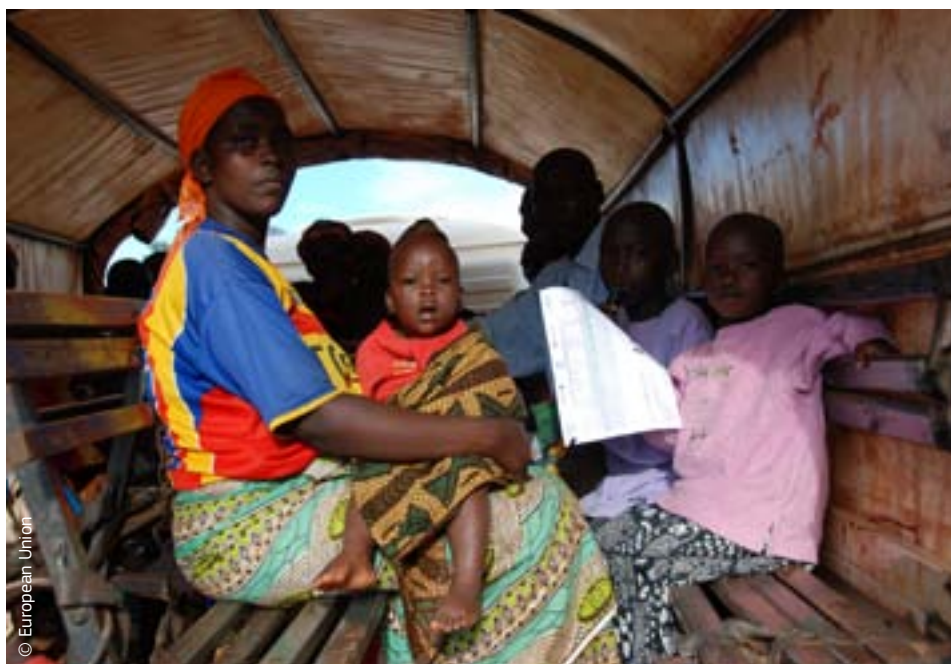
Burundyjska rodzina zmuszona do opuszczenia swojego domu mogła do niego wrócić dzięki pomocy UE

Abyśmy mogli zarządzać długotrwałymi skutkami katastrof oraz zwiększyć potencjał w zakresie zapobiegania i gotowości, pomocy humanitarnej i reagowaniu kryzysowemu muszą towarzyszyć działania w innych obszarach, w tym w zakresie współpracy rozwojowej i ochrony środowiska. Oznacza to, że konieczna jest koordynacja na poziomie UE.