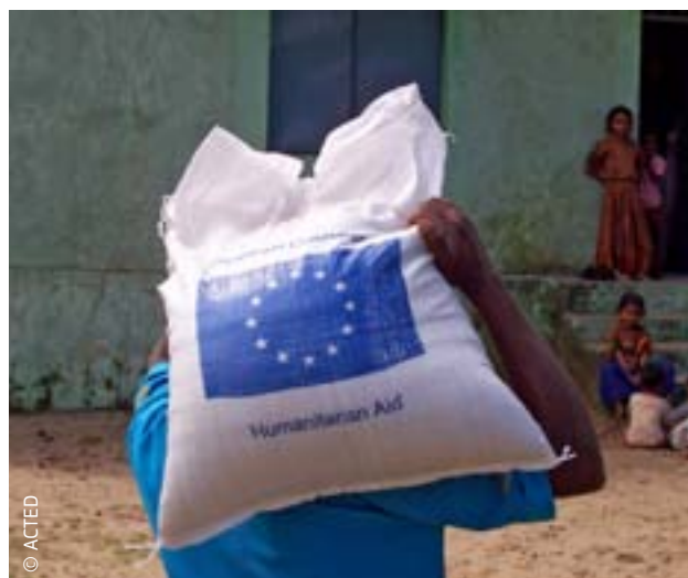
UE finansuje pomoc humanitarną w Indiach od 1996 r.

Aby pomóc krajom potrzebującym pomocy w uniknięciu katastrof, przygotować je na sytuacje nadzwyczajne i połączyć zasoby, które można udostępnić krajom będącym ofiarą katastrof, ustanowiono unijny mechanizm ochrony ludności. Podczas gdy pomoc humanitarna UE skierowana jest do krajów spoza Unii, zasoby mechanizmu mogą zostać zmobilizowane na potrzeby sytuacji nadzwyczajnych zarówno poza UE, jak i na jej terytorium. Unijny mechanizm ochrony ludności należy do narzędzi zacieśniających europejską współpracę w obszarze ochrony ludności. Wspiera on wysiłki krajów członkowskich podejmowane na szczeblu krajowym, regionalnym i lokalnym, dostarczając skutecznych narzędzi zapobiegania klęskom żywiołowym i tym spowodowanym przez człowieka, przygotowywania się do nich i reagowania na nie.