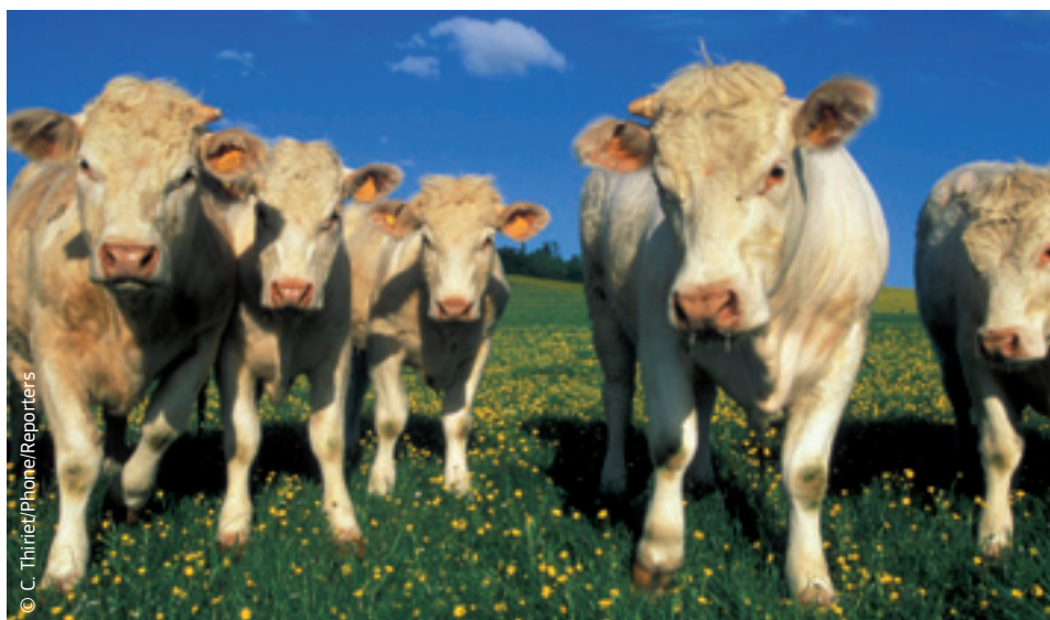
Rolnictwo musi zapewniać bezpieczną żywność dobrej jakości.

Komisja Europejska jest przedstawicielem UE w międzynarodowych negocjacjach prowadzonych przez Światową Organizację Handlu (WTO). Unia Europejska pragnie, aby Światowa Organizacja Handlu poświęciła więcej uwagi takim kwestiom, jak: bezpieczeństwo żywności, zasada ostrożności („lepiej dmuchać na zimne”) oraz dobrostan zwierząt.