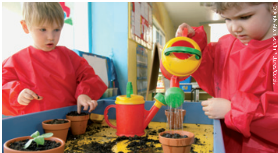
Dzisiejsza współpraca Europejczyków przyniesie lepsze jutro.

Jednocześnie kryzys gospodarczy pokazał, że kraje, które stosują euro jako swoją walutę, znajdują się w szczególnej sytuacji zależności, która uczyniła z nich centralną grupę państw w UE.