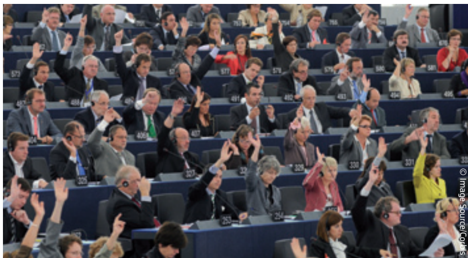
Parlament Europejski - to tu głos obywateli może zostać usłyszany.

W 2011 r. Niemiec Martin Schultz (Postępowy Sojusz Socjalistów i Demokratów) został wybrany przewodniczącym Parlamentu.