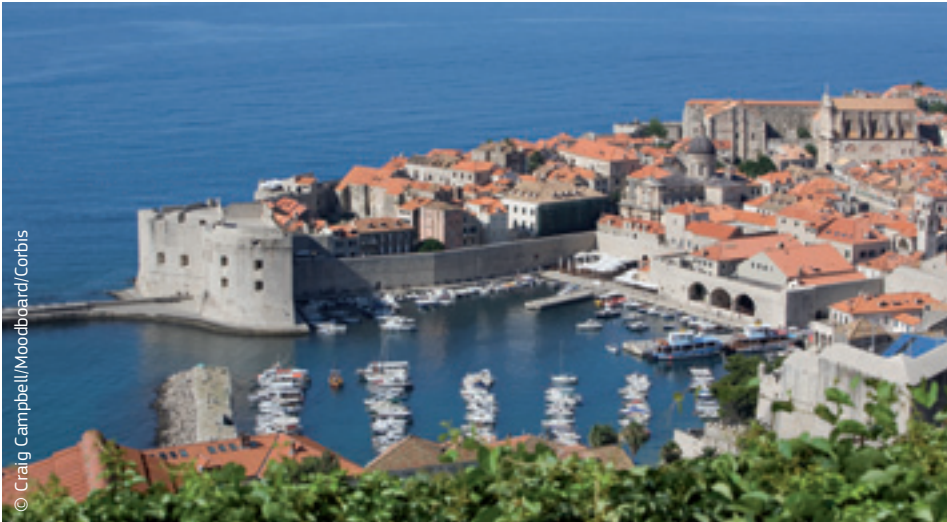
Perła Adriatyku – Dubrownik w Chorwacji, najmłodszym państwie członkowskim UE.