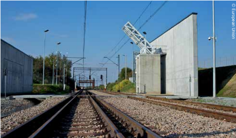
Kontrola wagonów na torach: skaner do prześwietlenia pociągów na przejściu granicznym między Ukrainą a Polską