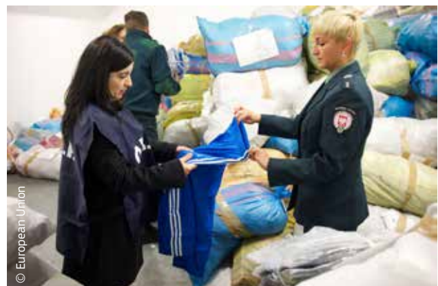
Sprawdzanie przechwyconych podrobionych produktów.

Organy celne odgrywają ponadto bardzo ważną rolę w gromadzeniu danych statystycznych. Gromadzone przez nie dane dotyczące wymiany handlowej pomagają europejskim decydom określać tendencje gospodarcze, a na podstawie ich dokumentacji podejmowane są decyzje dotyczące wprowadzenia limitów na towary, które mogą konkurować w sposób nieuczciwy z produktami unijnymi.